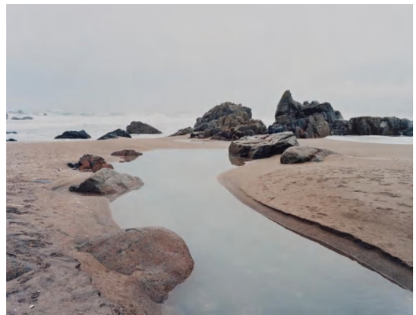
高橋和海 Round trip East Japan/青森県八戸市 2013