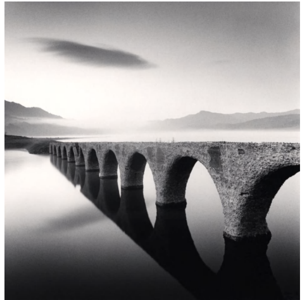
マイケル・ケンナ Taushubetsu Bridge, Nukabira, Hokkaido, Japan, 2008