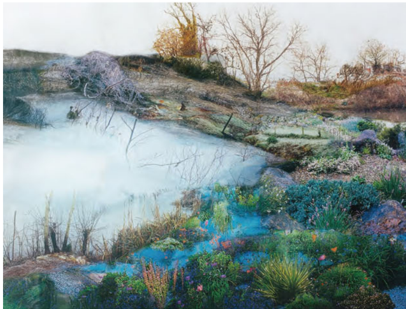
「絶え間なく沿う」 2011年 TypeCプリント