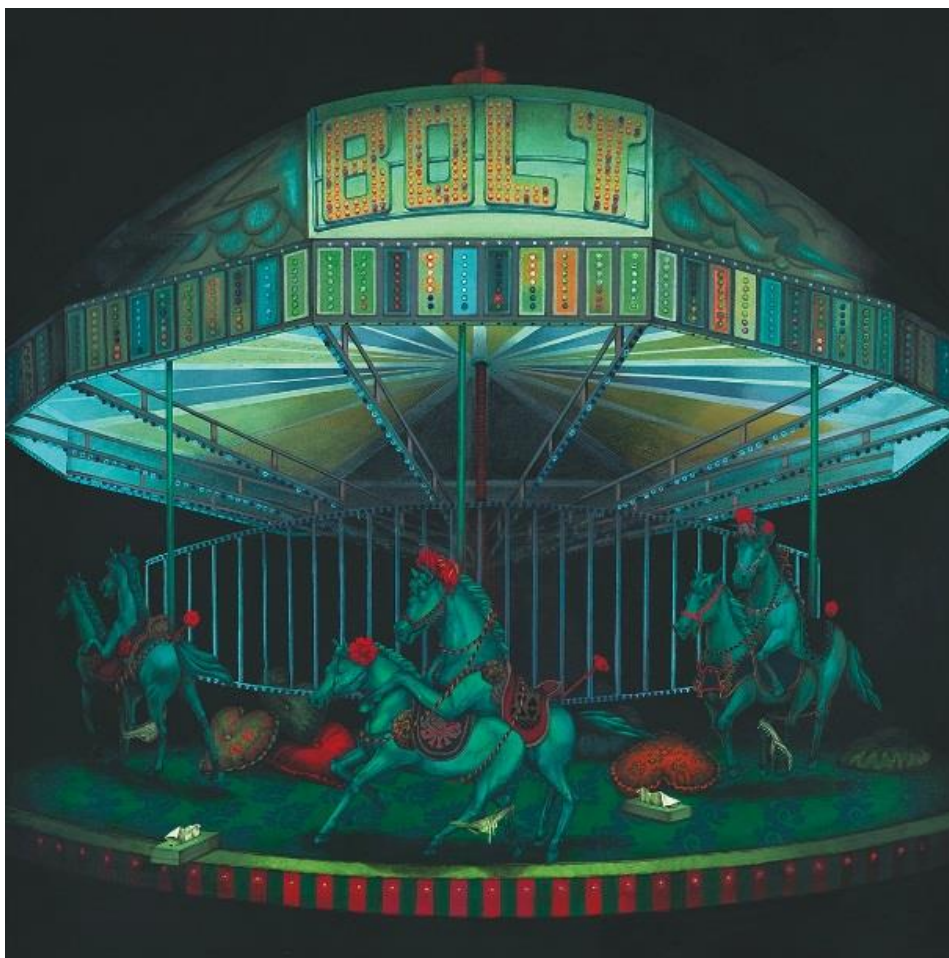
Carousel of Thanatos / タナトスの回転木馬