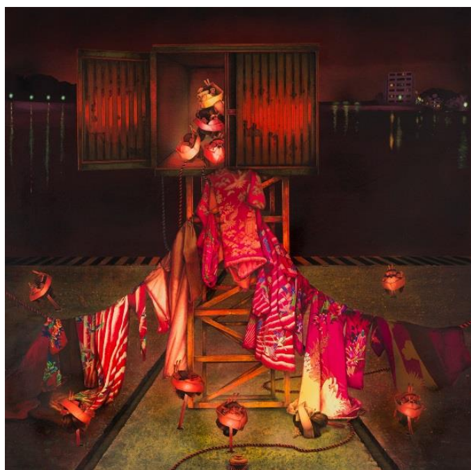
「密愛村Ⅲ」より 2009 6点組 個人蔵 Containers to Smuggle Maidens / 密輸される乙女たち (各) 60x60cm アクリル、紙