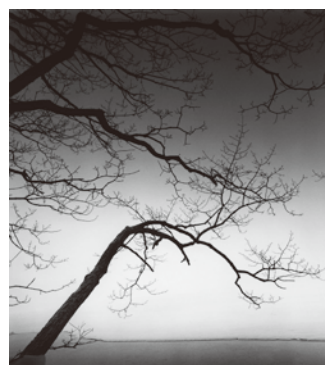
Eloquent Trees, Kussharo Lake, Hokkaido, Japan. 2013