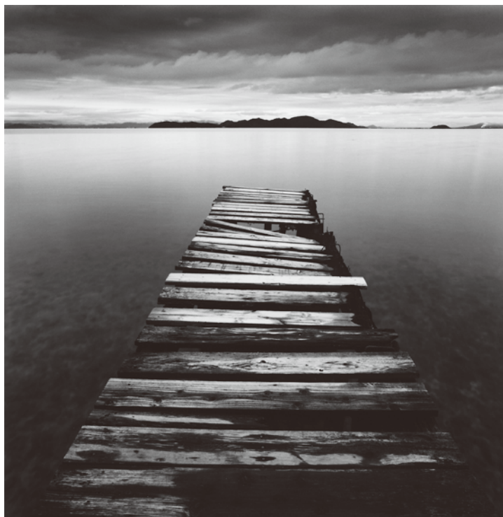
Crumbling Boardwalk, Shiga, Honshu, Japan. 2003