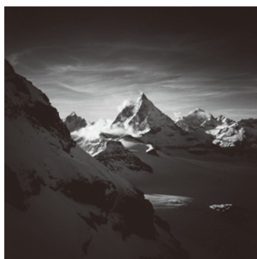
The Matterhorn, Pennine Alps, Switzerland. 1994