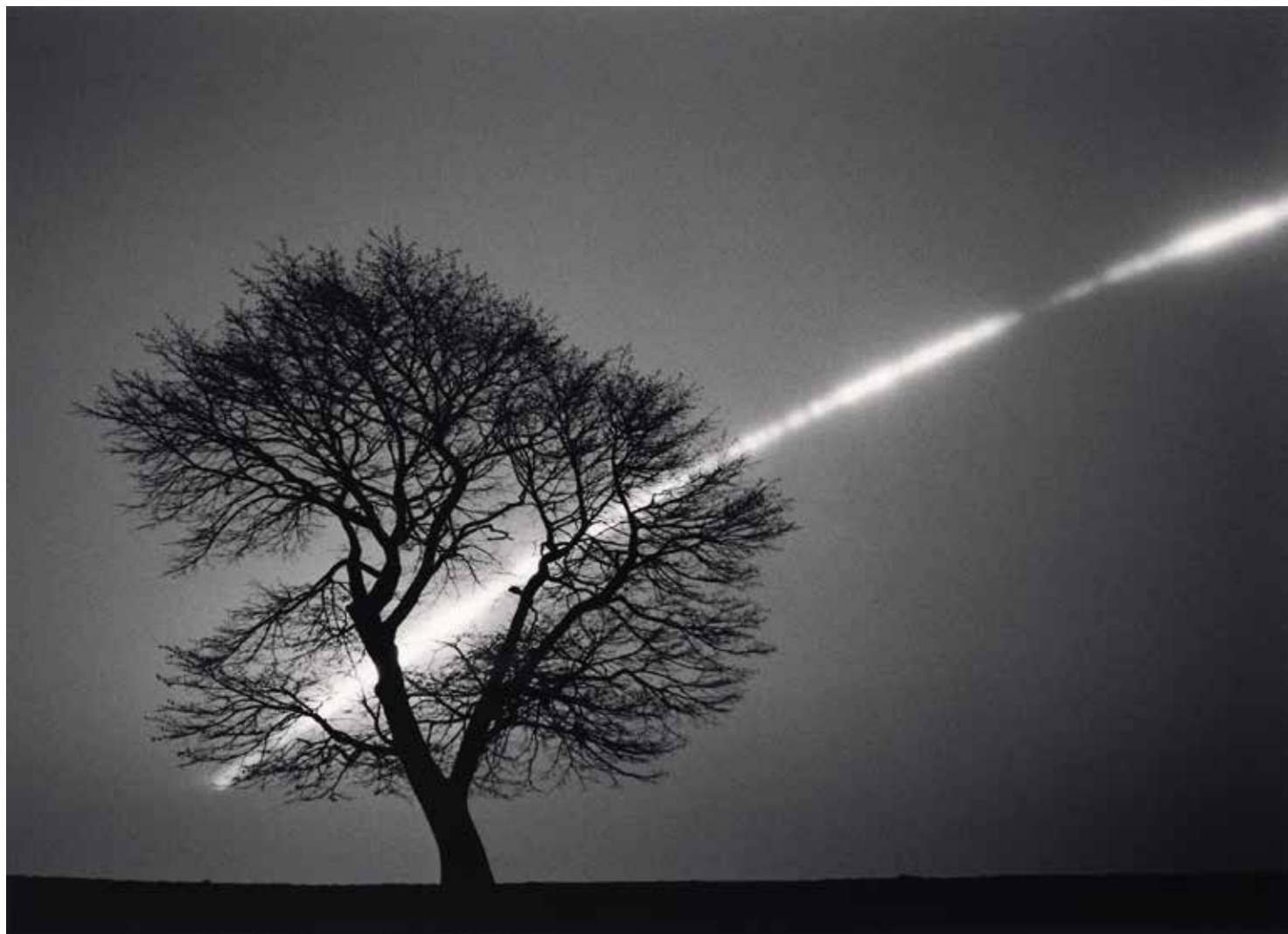
Sakura and Full Moon, Study 1, Urakawa, Hokkaido, Japan, 2015