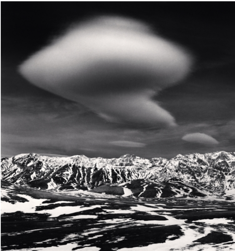
Curious Cloud, Campo Imperatore, Abruzzo, Italy. 2016

ハッセルブラッドの正方形のフォーマットに長時間露光による時間の変化を封じ込める写真家、マイケル・ケンナ。世界で最も人気のある写真家の一人であるケンナは、Facebook でも約50万人のファンを擁しています。ケンナは日本を愛し毎年のように日本を訪れ撮影、昨年、北海道の連作により第32回東川賞特別作家賞を受賞しました。高質な写真集を出すことでも知られるケンナの新刊は、イタリアのアドリア海に面したアブルツォ州を特集した『ABRUZZO』。日本語版の出版を記念し、ケンナが11月中旬に来日、ギャラリー・アートアンリミテッドではサイン会を行います。今回の展示では、新作のABRUZZOをはじめ、昨年再刊された『THE ROUGE』(アメリカ。ピッツバーグの工場地帯)や『Lace Factory』(フランスの古いレース工場を撮影)など、美しい自然のみならず、工場地帯など社会的なテーマも巧みな構図と技術で撮影する多彩な側面をご紹介します。