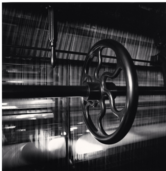
Lace Factories, Study 7, Calais, France, 1993