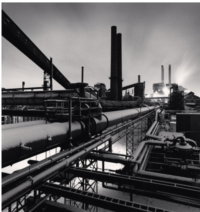
The Rouge, Study 60, Dearborn, Michigan, USA. 1994