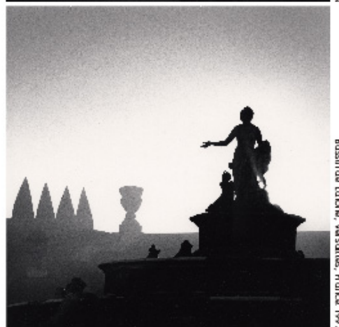
Bassin de Labor, Versailles, France, 1997