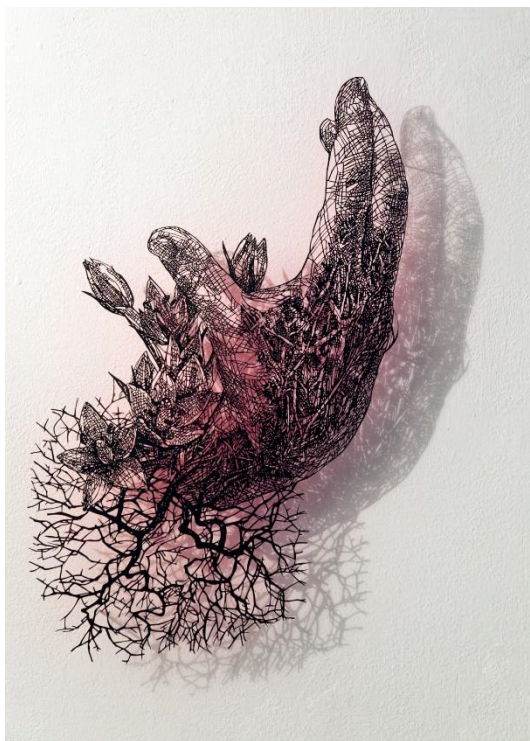
「最後の晩餐—イエスの手Ⅱ」2018 切り絵、アクリル絵の具

Aya MORITA The Last Supper— Hands of Jesus II 2018