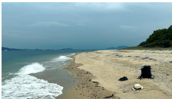
《海影記（予告編）》より 3分18秒 2022

“The Shades of Night (trailer)” 2 min 59 sec 2022