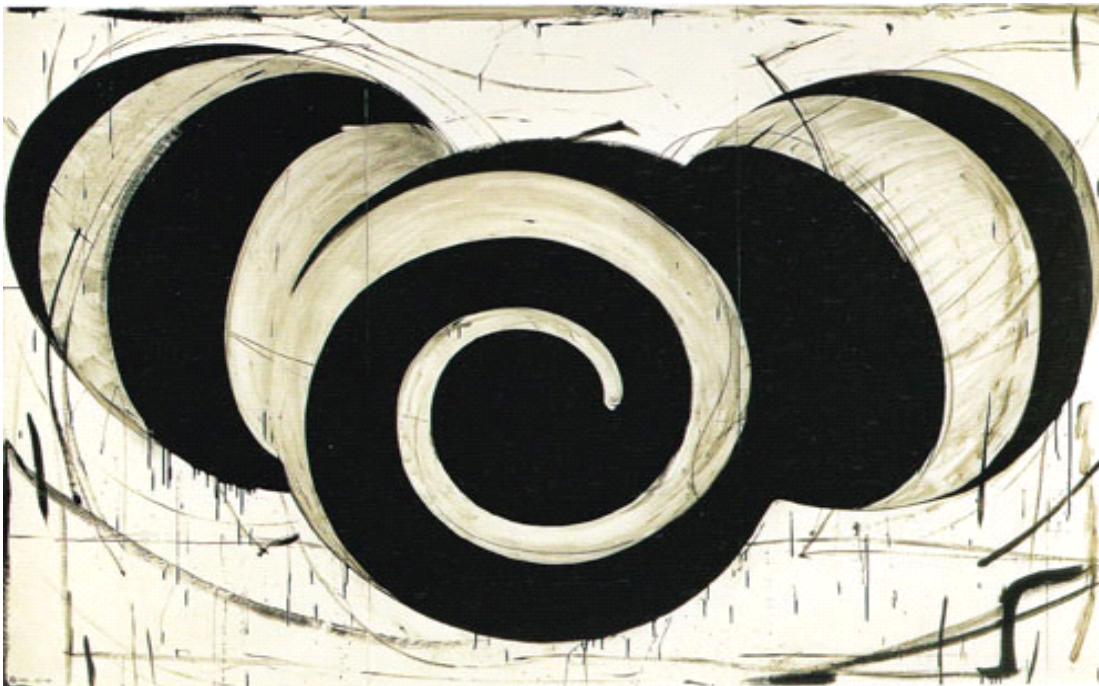
吉澤美香「にー24」1991, A B S樹脂、シルクスクリーンインク 200×300cm