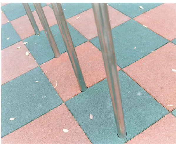
1489-05 Taipei City, Taiwan 2017

※出品作品はプレスリリースと異なる場合がございます。詳細はお問い合わせ願います。