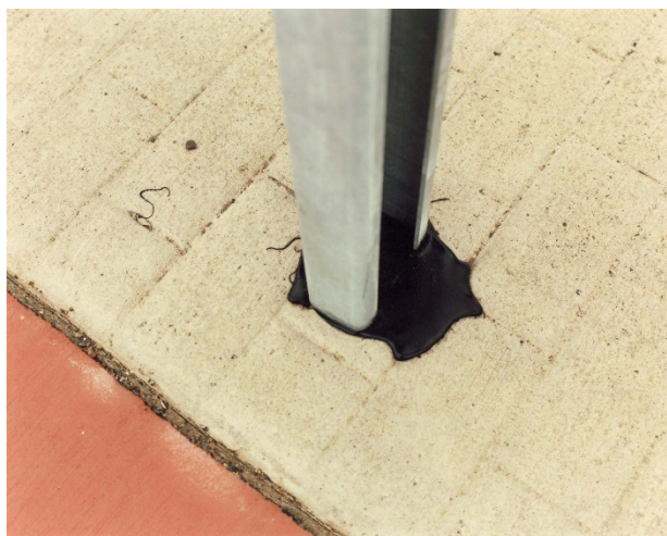
1308-10 Meerhout, Belgium 2015